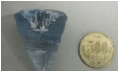
酸化ガリウム単結晶 (次世代パワー半導体用)