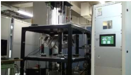
高純度単結晶製造装置 (パネル展示予定)